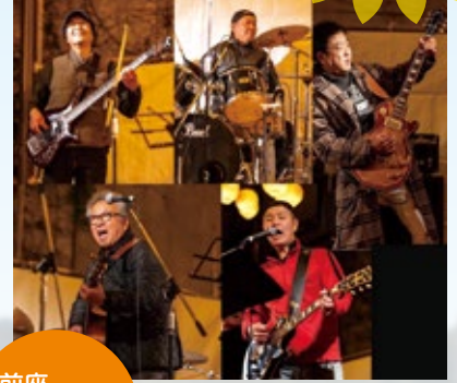
前座おっさんバンド

まんのう町出身で観光大使。童謡・唱歌から芸術歌唱曲まで幅広く日本歌曲を専門とし、日本全国でコンサート活動をしています。