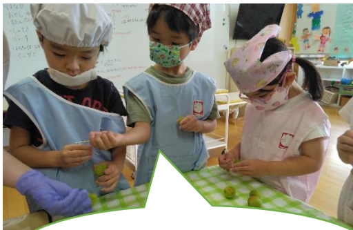
梅の下処理から子ども達が行いました。

と、たくさん出たアイデアをもとにみんなで相談して、「ミックスベリー」「レモン」「マンゴー」のシロップを作ることに決めました。