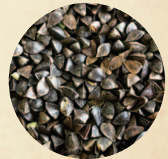
脱穀したそばの実